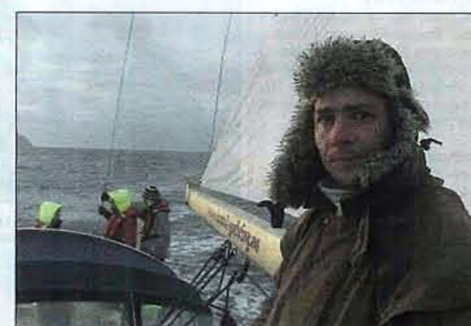
PÅ EGEN HÅND: Målet er at elevene på slutten av skoleåret skal ut på en lang seilas på egen hånd, uten hjelp fra lærer.