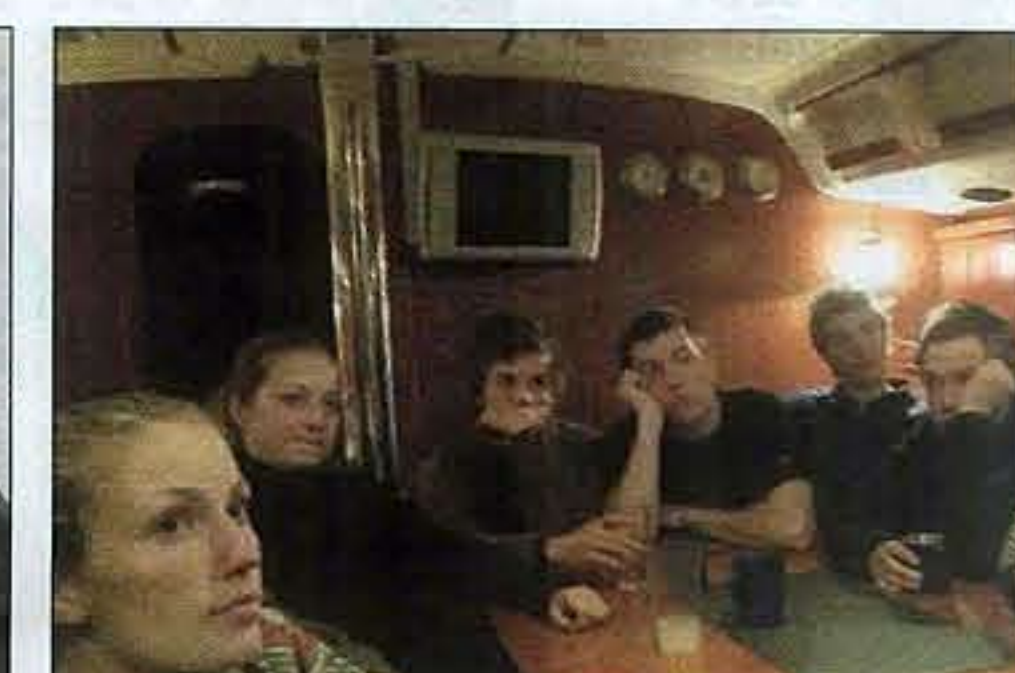
PÅ EGEN HÅND: Målet er at elevene på slutten av skoleåret skal ut på en lang seilas på egen hånd, uten hjelp fra lærer.